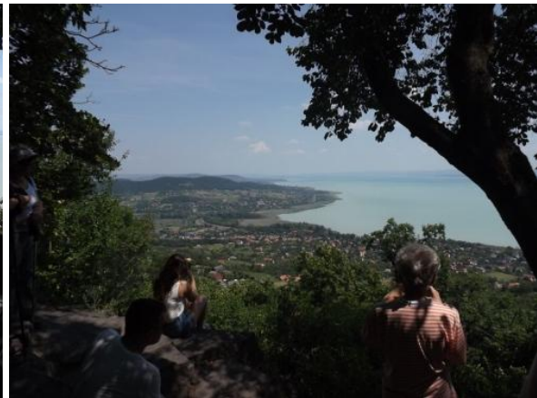
A lépcsőkön leereszkedtünk a Rózsa-kőhöz:

Rózsa-kő a hegyoldalról lehasadt bazaltkő valószínűleg Kisfaludy Rózájáról kapta a nevét, amelyet 1886-ban be is véstek a szikla oldalába. A néphit azután fontos szerepet adott a kőnek: a hagyomány szerint, ha egy fiú és egy leány a Balatonnak hátat fordítva leül rá, még abban az esztendőben jegyesek lesznek, sőt, elég, ha a kedveséért sóhajtó leány ül rá, szerelmük ez esetben is beteljesedik.